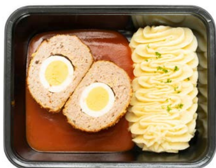
Vogelnestje tomatensaus met puree Nid d'oiseau au sauce tomate avec purée