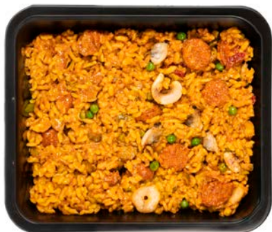
Paella rustica (zeevruchten en chorizo) Paella rustica (mix fruit de mer/chorizo)