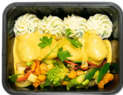
Gehaktballetjes in mosterdsaus met puree Boulettes de haché, sauce moutarde et purée