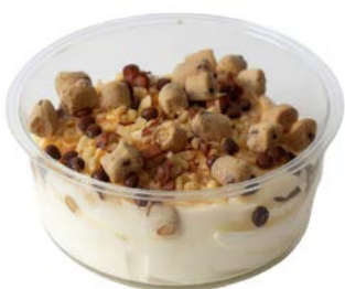
Cookie dough dessert Dessert pâte à cookie