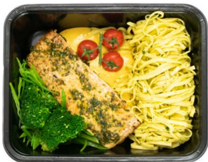
Zalm pesto met tagliatelli Saumon pesto tagliatelli