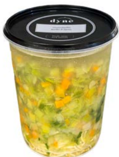
Groentenbouillon soep Potage de bouillon de légumes