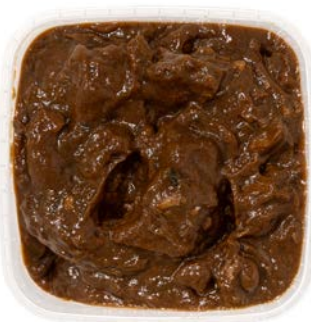
Stoofvlees Ragoût de boeuf