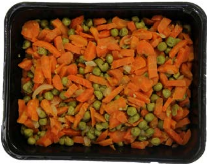
Ertjes en worteltjes gestoofd met ajuin Petits pois et carottes braisés avec oignon