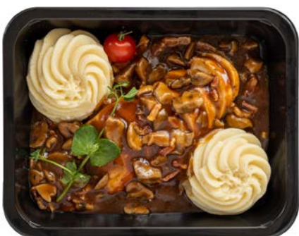
Coq au vin met aardappelpuree Coq au vin et purée de pommes de terre