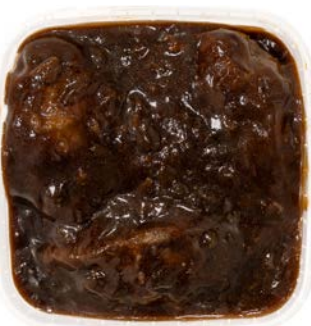
Varkenswangen Joues de porc