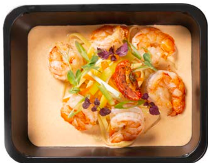
Scampi van de chef met pasta Scampi du chef avec pâtes