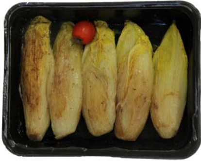
Witloof gestoofd Chicons braisée