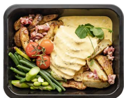
Hoevekip met béarnaise saus Poulet au sauce béarnaise