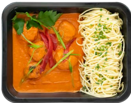
Spaanse kipballetjes met tomatensaus Boulettes de poulet espagnoles à la sauce tomate