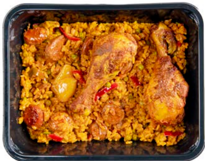
Paella kip en chorizo Paella poulet chorizo