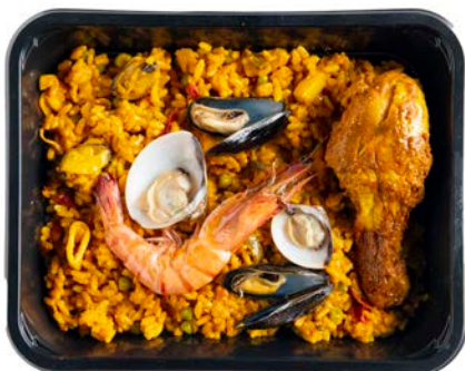
Paella zeevruchten en kip Paella fruit de mer et poulet