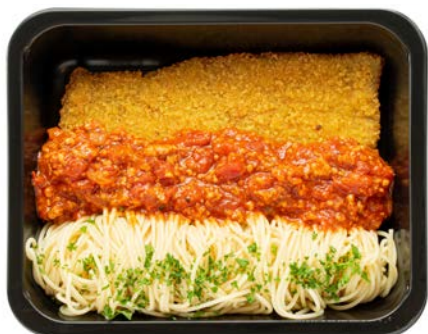
Escalope Milanaise met pasta Escalope Milanaise avec pâtes