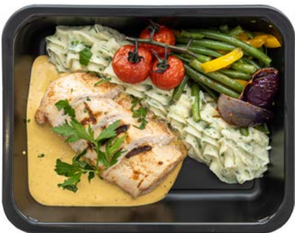
Kipfilet met mosterdsaus Filet de poulet à la sauce moutarde