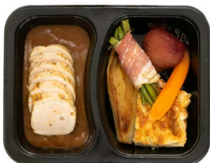
Gevulde Mechelse koekoek, gratin en groentjes Coucou de Malines farci, gratin et légumes