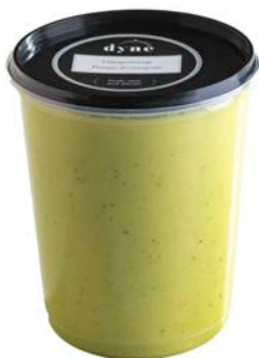
Courgettesoep Potage de courgette