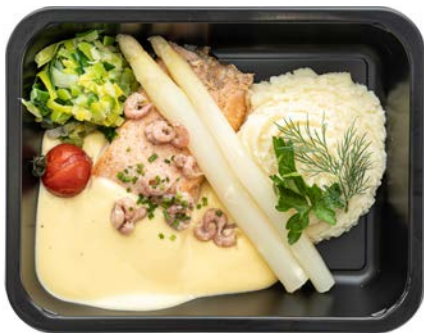
Zalmfilet met asperges en botersaus Filet de saumon en sauce au beurre avec asperges