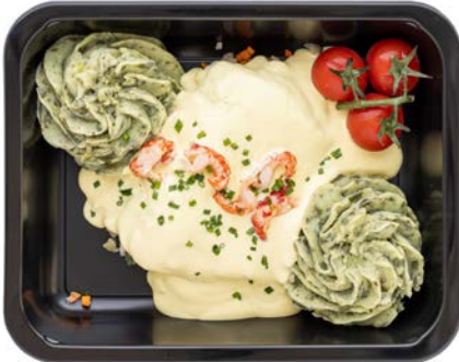
Kabeljauw met blanke botersaus Cabillaud sauce au beurre blanc