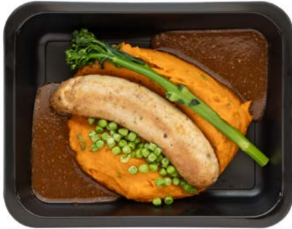
Kippenworst met zoete aardappelpuree Saucisse de poulet avec purée de patates douces