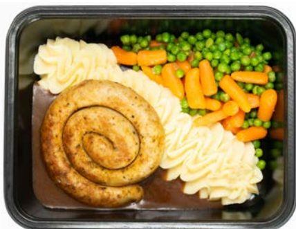
Chipolata met puree, wortelen en erwten Chipolata avec purée, carottes et petits pois