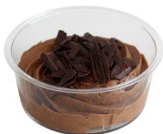
Chocolademousse met chocoladeschilfers Mousse au chocolat avec copeaux de chocolat