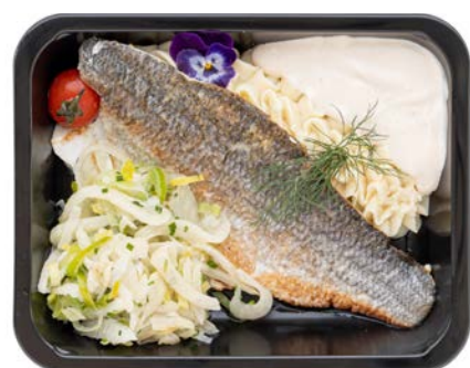
Zeebaars in witte wijnsaus met puree Bar à la sauce au vin blanc avec purée