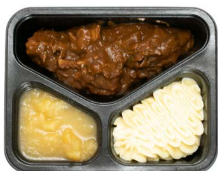
Stoofvlees met appelmoes en puree Carbonade avec compote de pommes et purée