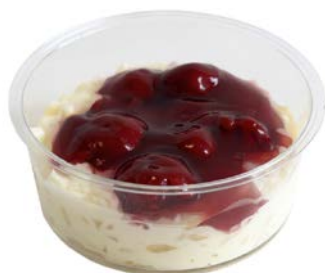
Rijstpap met krieken Riz au lait avec des griottes