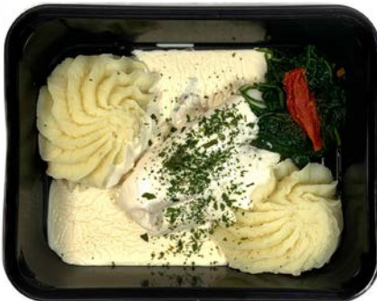
Kabeljauw met witte wijnsaus, spinazie en puree Filet de cabillaud à la sauce vin blanc, épinards et purée