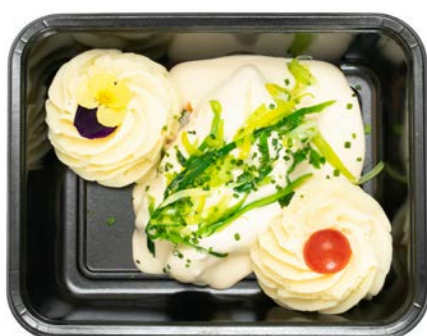
Tongrolletjes gevuld met puree Rouleaux de sole farcis à la purée