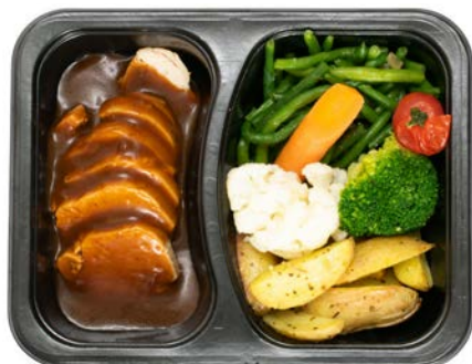
Bressekip met aardappelen en groenten Poulet de Bresse avec légumes et pommes de terre