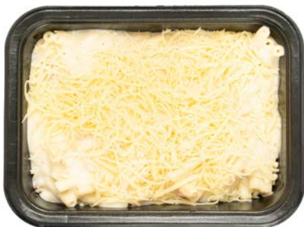
Macaroni met ham in kaassaus Macaroni jambon sauce fromage