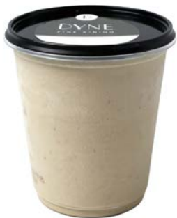
Champignonsoep Potage aux champignons