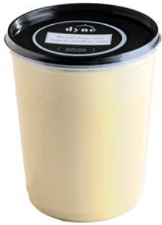
Aspergesoep Potage aux asperges