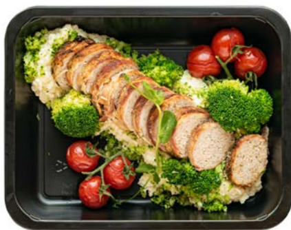
Spekrol met bloemkoolrisotto en broccoli Rouleau de lard avec risotto au chou-fleur et brocoli