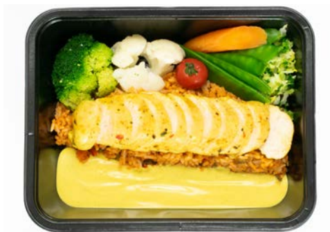
Gemarineerde kip met curry, groentjes en rijst Poulet mariné au sauce curry, légumes et riz