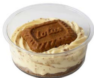
Tiramisu met speculoos Tiramisu au spéculoos