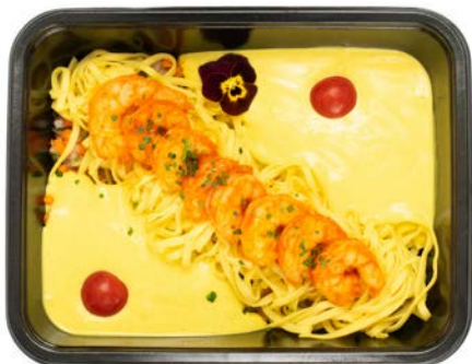
Scampi in zachte currysaus met tagliatelle Scampi sauce au curry doux et tagliatelle