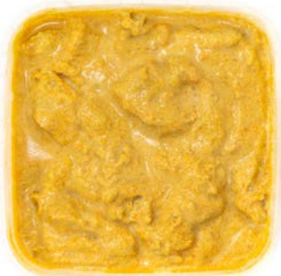
Kip met thaise gele curry Poulet au curry jaune thai