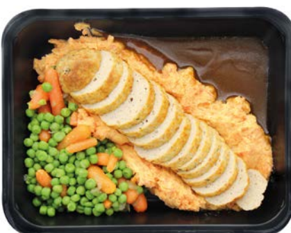
Kippenboomstammetje met wortelen, erwten en puree Buchette de poulet avec petit pois, carottes et purée