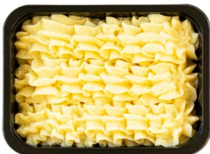
Aardappelpuree Purée de pommes de terre