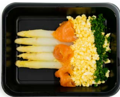
Asperges met gerookte zalm Asperges avec saumon fumé