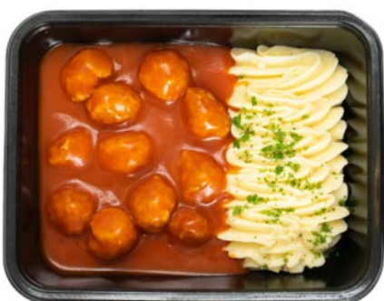
Gehaktballen mini in tomatensaus met puree Mini-boulettes sauce tomate avec purée