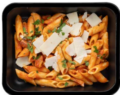
Pasta all'arrabiata Pâtes all'arrabiata