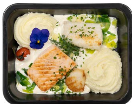
Vispannetje van de chef met coquilles Poêlée de poisson du chef avec coquilles