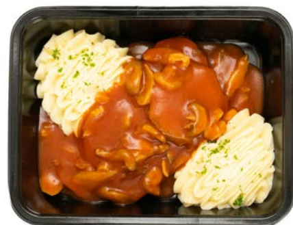
Rundstong in madeirasaus en puree Langue de boeuf au sauce madère et purée