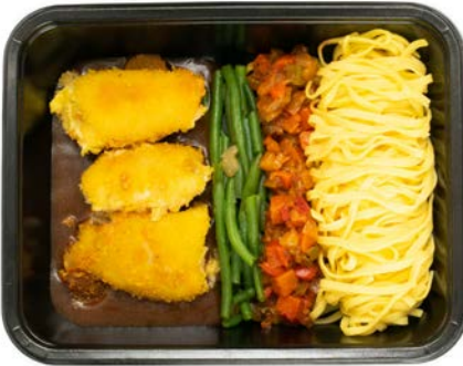
Kippen cordon bleu met ratatouille en tagliatelle Cordon bleu de poulet, ratatouille et tagliatelle