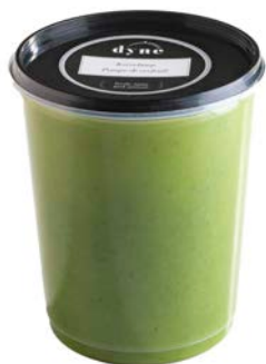
Kervelsoep Potage de cerfeuil