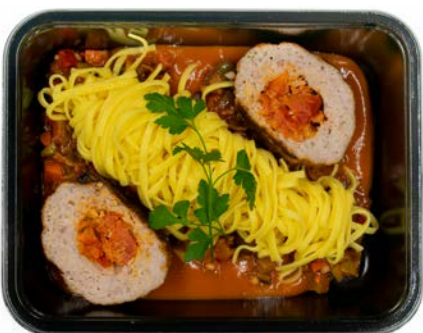
Gehaktbal gevuld met tomaat en mozzarella met pasta Boulette farcie aux tomates et mozzarella avec pâtes