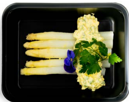
Asperges met hollandaise saus Asperges à la sauce hollandaise