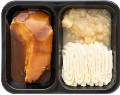
Kipfilet met appelmoes en puree Filet de poulet compote de pommes et purée