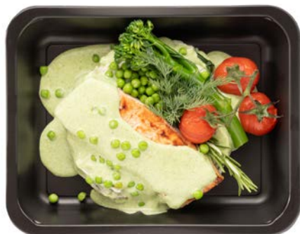
Zalmfilet met kruidenpuree Filet de saumon à la purée d'herbes