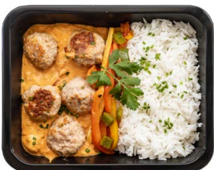
Kippenballetjes in Stroganoffsaus met rijst Boulettes de volaille à la sauce Stroganoff avec riz