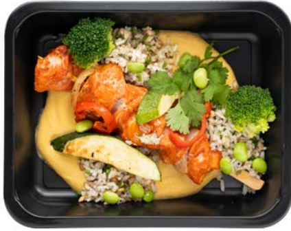
Brochette met bruine rijst en gele curry Brochette au curry avec du riz complet