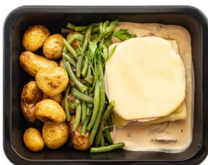
Kippenorlof met archiduc saus Poulet façon Orloff en sauce archiduc