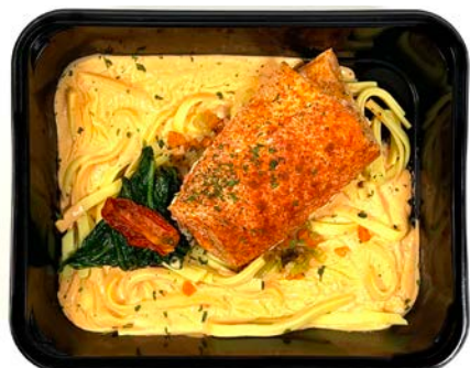
Zalm in sausje van de chef met pasta Saumon à la sauce du chef avec pâtes