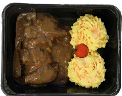
Varkenswangen met wortelpuree Joues de porc avec puree de carottes