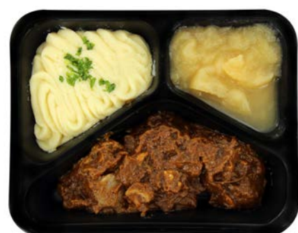
Stoofpotje van konijn met appelmoes en puree Ragoût de lapin avec compote de pommes et purée