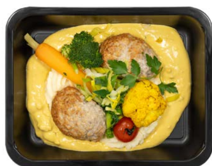
Vleesbroodje in pickelsaus Pain de viande à la sauce pickles