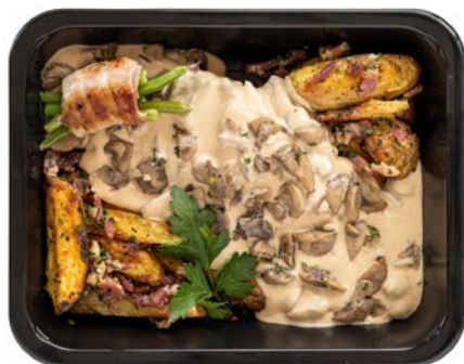
Varkenshaasje archiduc met gebakken aardappelen en spek Filet de porc archiduc pommes de terres et lardons