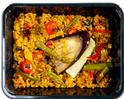
Paella vegetarisch Paella végétarienne