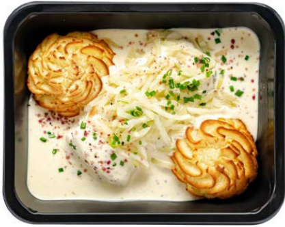
Kabeljauw met mosterdsaus en venkel Cabillaud à la sauce moutarde et fenouil