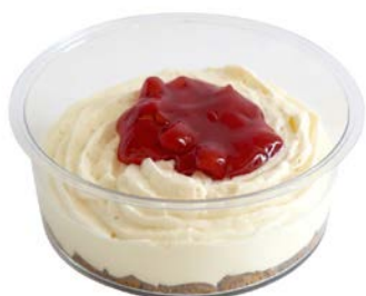
Cheesecake aardbei speculoos Cheesecake à la fraise et au spéculoos