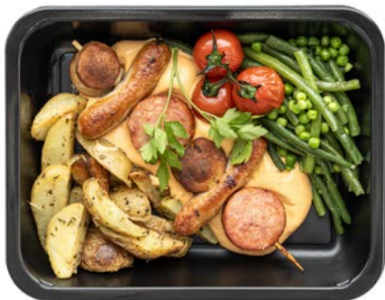
Brochette met aardappelen Brochette avec pommes de terre