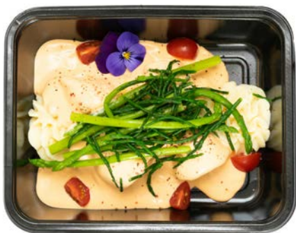
Scharrolletjes met puree Filets de limande à la purée