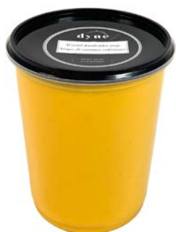
Wortel-knolseldersoep Potage carotte céleri-rave

U: 010.86.515 F: 2200005 6 x 1 l U: 010.86.527 F: 2200011 6 x 500 ml