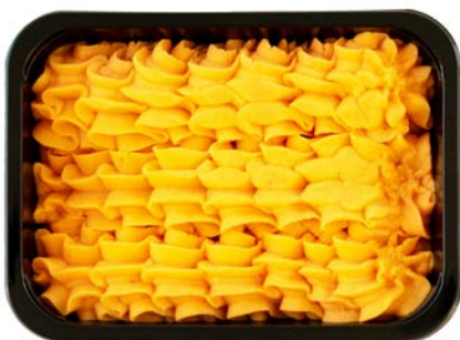
Wortelpuree Purée de carottes