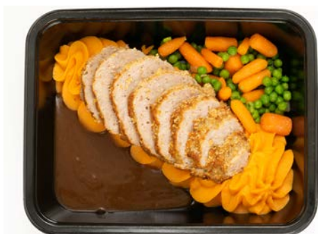
Vleesbrood met erwten, wortelen en puree Pain de viande avec petits pois, carottes et purée