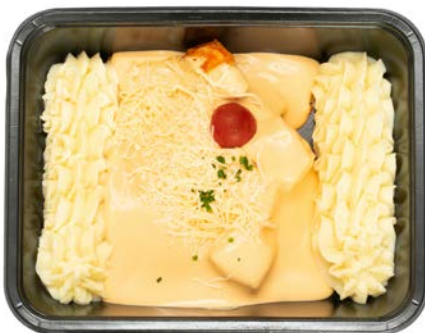
Vispannetje met kreeftensaus Poêlée de poisson sauce au homard