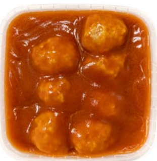
Balletjes in tomatensaus Boulettes sauce tomate