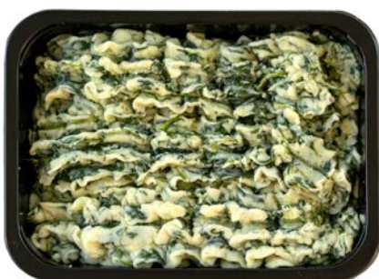
Spinaziepuree Purée d'épinards