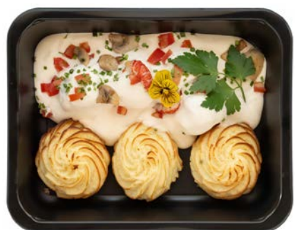
Tongrolletjes pommes duchesse met witte wijnsaus Rouleaux de sole pommes duchesse et sauce au vin blanc