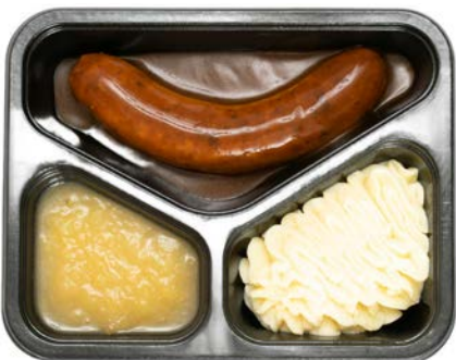
Worst met appelmoes en puree Saucisse avec compote de pommes et purée