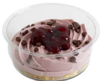
Amarena kersen dessert Dessert cerises Amarena