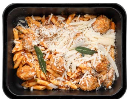
Pasta con polpette Pâtes con polpette