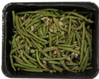
Fijne boontjes gestoofd met spekblokjes en ajuin Haricots fines braisés, lardons et oignon