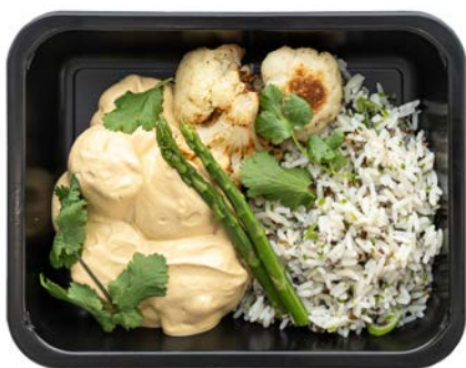
Tongrolletjes met gele currysaus Rouleaux de sole à la sauce curry jaune