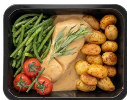
Polderkip met dragonsaus en groene boontjes Poulet des Polders à la sauce estragon et haricots verts