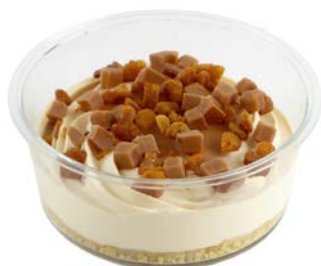
Dulce de lèche met crumble Dulce de lèche avec crumble