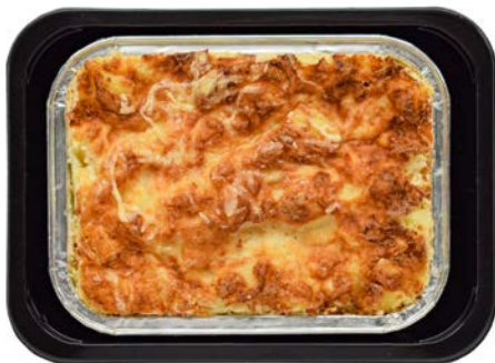
Aardappelgratin van polderaardappelen Gratin dauphinois