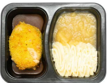
Zwitserse schijf met appelmoes en puree Steak Suisse avec compote de pommes et purée