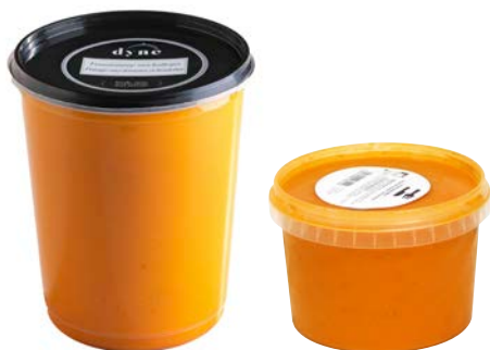
Tomatensoep met balletjes Potage aux tomates et boulettes

U: 010.86.515 F: 2200005 6 x 1 l U: 010.86.527 F: 2200011 6 x 500 ml