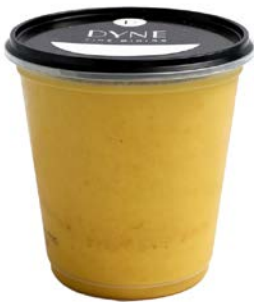
Butternut soep Potage de butternut