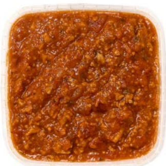
Spaghetti saus Sauce bolognaise