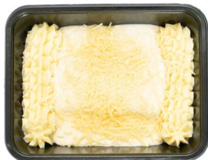
Hamrolletjes witloof in een kaassaus en puree Chicons gratin avec purée