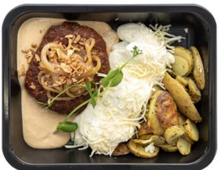
Rundshamburger pepersaus Hamburger de boeuf sauce à la poivre