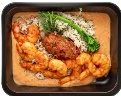
Scampi met romige tomatensaus en bruine rijst Scampi à la sauce tomate crémeuse et riz brun