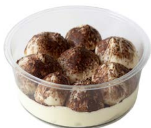
Tiramisu klassiek Tiramisu classique