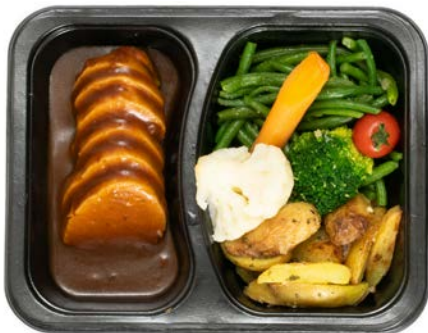
Varkenshaasje aardappelen en groentjes Filet de porc aux pommes de terre et légumes