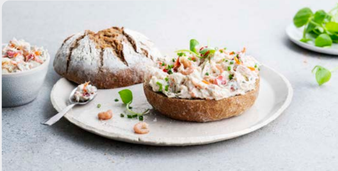
NOORDZEEALADE MET GARNAAL SALADE DE LA MER DU NORD AUX CREVETTES