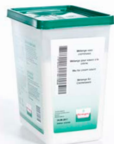
CREMESAUS MIX FIJN MÉLANGE POUR SAUCE À LA CRÈME

Verstegen U: 222.97.742 F: 5633011 2.7 l