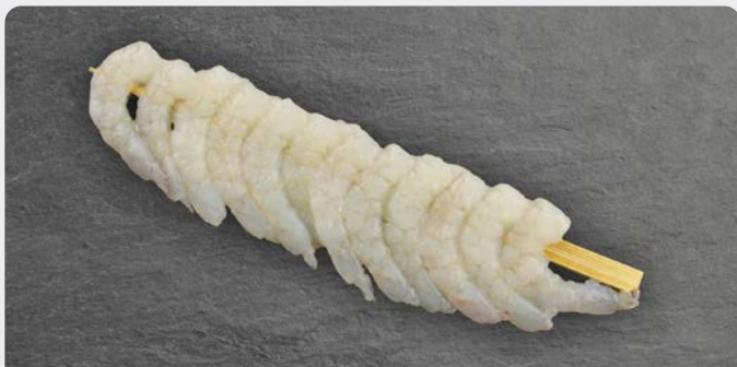
SCAMPI BROCHETTE BROCHETTE DE SCAMPIS