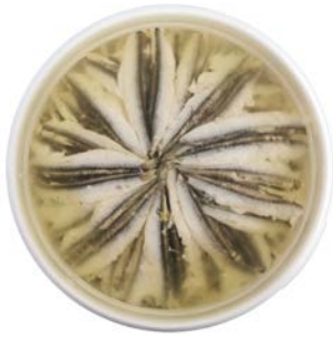
ANSJOVIS GEMARINEERD ANCHOIS MARINÉS