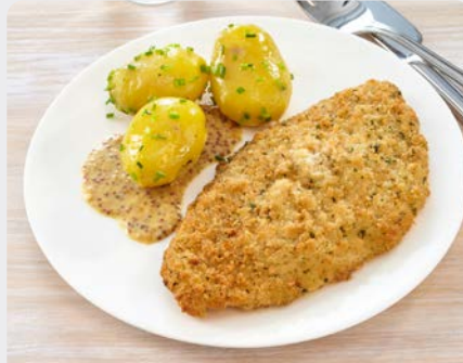
SCHOLFILET PETERSELIEPANEER FILET DE PLIE PANÉ AU PERSIL