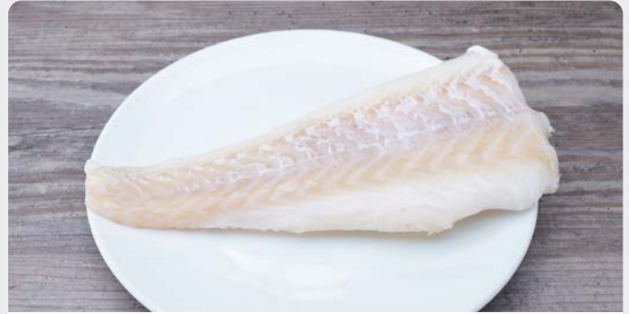
KABELJAUWSTAART QUEUE DE CABILLAUD

Deutsche See U: 179.00.231 F: 6202033 4.5 kg ❄️