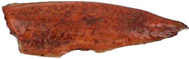
WARM GEROOKTE ZALM MET KRUIDEN SAUMON FUMÉ À CHAUD AUX HERBES