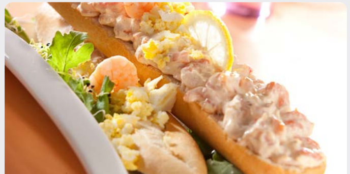
ROZE GARNAALSALADE SALADE DE CREVETTES ROSES