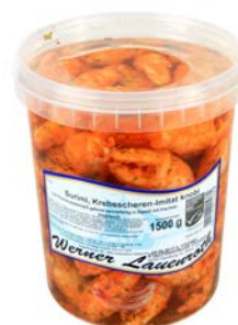
SURIMI KRABPOOTJES LOOKOLIE PATTES DE GRABE SURIMI À L'HUILE D'AIL

W. Lauenroth U: 153.60.021 F: 1503358 2 x 1.5 kg