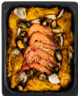
PAELLA ZEEVRUCHTEN KIP PAELLA FRUITS DE MER POULET