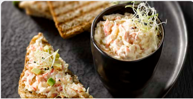
KRABSALADE SALADE DE CRABE