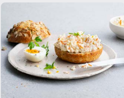
SURIMISALADE SALADE DE SURIMI