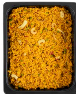
PAELLA RIJSTMIX ZEEVRUCHTEN PAELLA MIX DE RIZ FRUITS DE MER