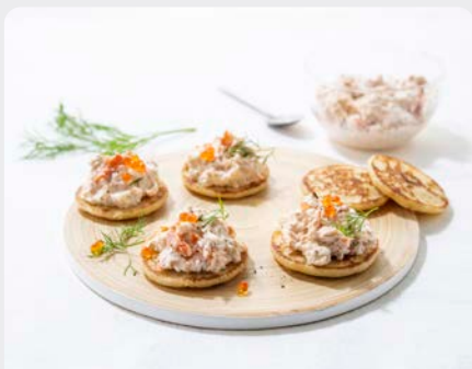
GEROOKTE ZALMFOREL TRUITE SAUMONÉE FUMÉE