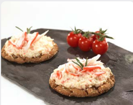
KRABSALADE SALADE DE CRABE

Delitas U: 179.00.350 F: 1503022 1.25 kg