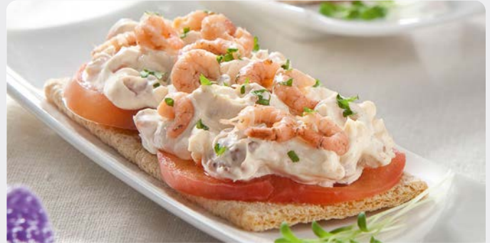
GARNAALSALADE SALADE DE CREVETTES