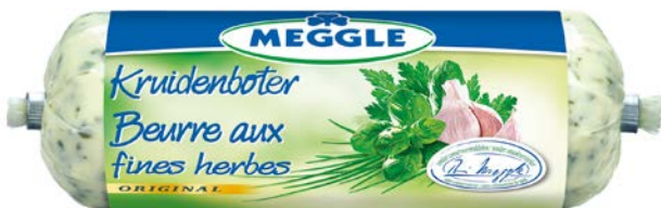
KRUIDENBOTER BEURRE AUX HERBES