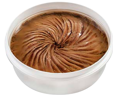
ANSJOVIS GEZOUTEN ANCHOIS SALÉS