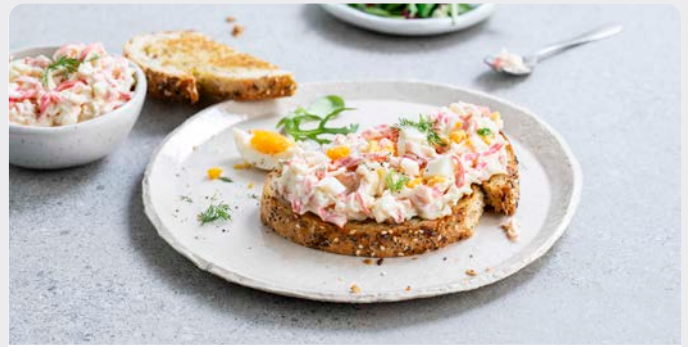
KRABSALADE SUPER SALADE DE CRABE SUPER