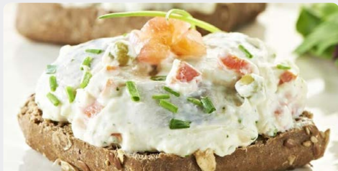
HARINGSALADE SALADE DE HARENG