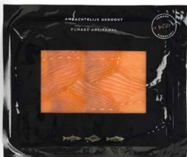
ARTISANAAL GEROOKTE ZALM SAUMON FUMÉ ARTISANAL