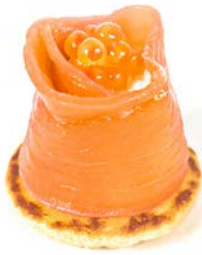
BOUCHEE ZALM - KAAS - FORELEITJES BOUCHÉE SAUMON - FROMAGE - ŒUFS DE TRUITE