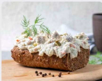
HARING IN DILLE HARENG À L'ANETH