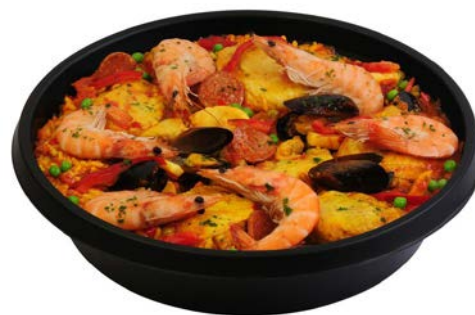
PAELLA VALENCIANA PAELLA VALENCIENNE