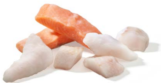
VISSERSPALLET PLATEAU DU PÊCHEUR