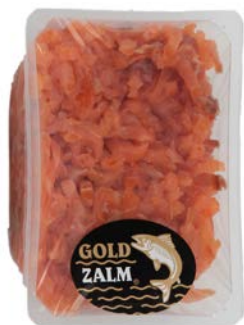
GEROOKTE ZALMREEPJES LAMELLES DE SAUMON FUMÉ