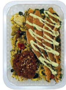
PASTA SALADE SALADE DE PÂTES

Maison fumée U: 296.86.004 F: 1600007 5x250g