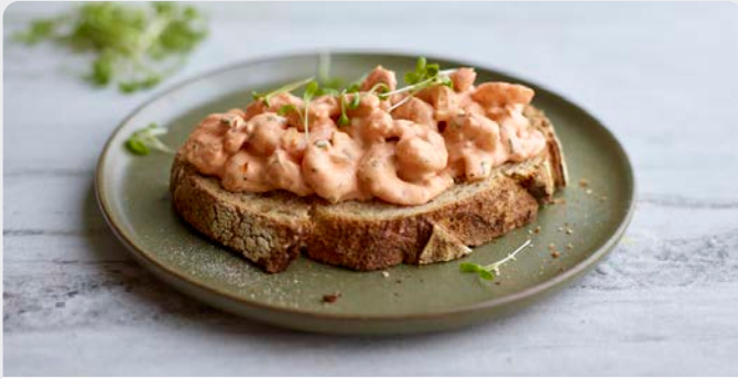
SCAMPI DIABLO SCAMPIS DIABLO