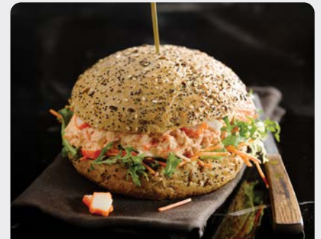
KREEFT SURIMI SALADE SALADE DE SURIMI AU HOMARD