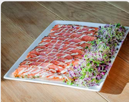
GEKARAMELISEERDE GEROOKTE ZALM SAUMON FUMÉ CARAMÉLISÉ