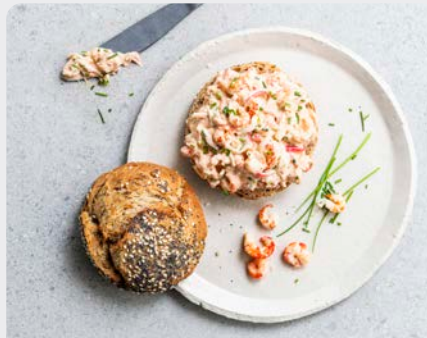
RIVIERKREEFT SURIMI SALADE SALADE D'ÉCREVISSES ET SURIMI