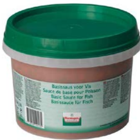
BASISSAUS VOOR VIS SAUCE DE BASE POUR POISSON

Verstegen U: 178.00.881 F: 5633039 2.7 l