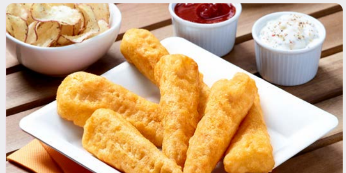
KABELJAUW FISH AND CHIPS CABILLAUD FISH AND CHIPS