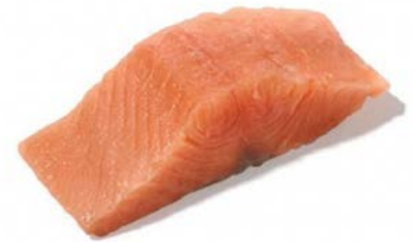
ATLANTISCHE ZALMPORTIE 150G TRIM E DEEPSKIN PORTION DE SAUMON ATLANTIQUE 150G TRIM E DEEPSKIN

Vanafish U: 179.00.253 F: 3701002 1.1 kg