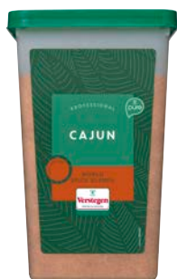
CAJUN KRUIDEN FIJN PURE CAJUN PURE