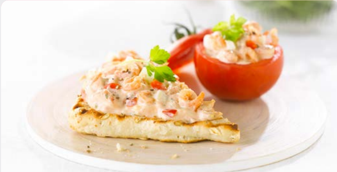
TOMAAAT GARNAAL SALADE SALADE TOMATE-CREVETTES