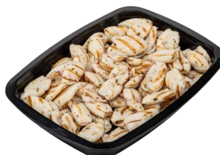
GEGRILDE CALAMARS CALAMARS GRILLÉS

Riviera Sopida U: 460.60.003 F: 2004219 1 kg