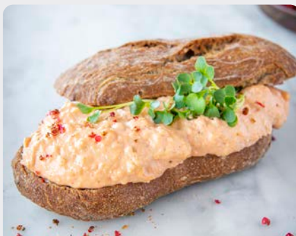
ZALMSALADE SALADE DE SAUMON