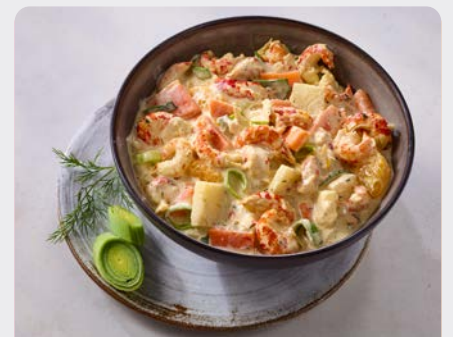
SALADE RIVIERKREEFT APPEL CALVADOS SALADE ÉCREVISSES POMME CALVADOS