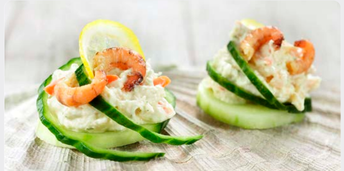
NOORDZEEALADE SALADE DE LA MER DU NORD