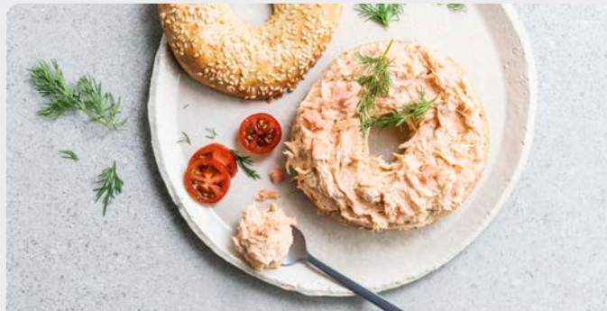
ZALMSALADE BELLE VUE SALADE DE SAUMON BELLE VUE