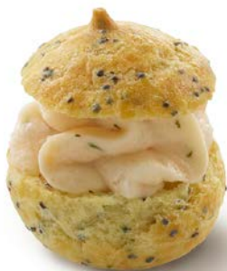
CHOU MET GEROOKTE ZALM CHOU AU SAUMON FUMÉ