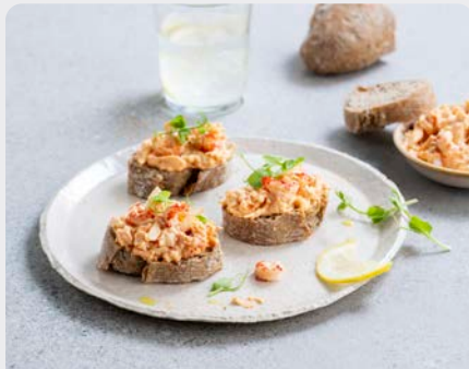
KREEFTSALADE SALADE DE HOMARD