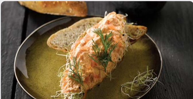
ZALMSALADE SALADE DE SAUMON