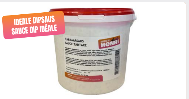
TARTAARS AUS SAUCE TARTARE

Selected by Henri U: 507.57.001 F: 4001092 5 kg