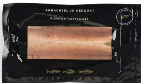
GEROOKTE FORELFILET FILET DE TRUITE FUMÉE