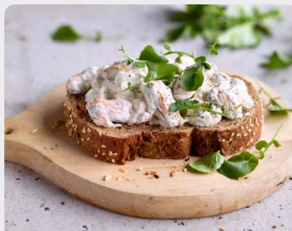
MOSSEL TARTAAR TARTARE DE MOULES