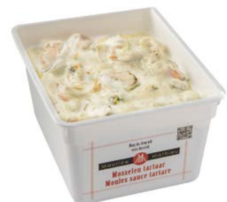
MOSSEL TARTAAR TARTARE DE MOULES