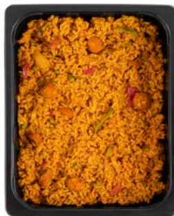
PAELLA RIJSTMIX CHORIZO PAELLA MIX DE RIZ CHORIZO