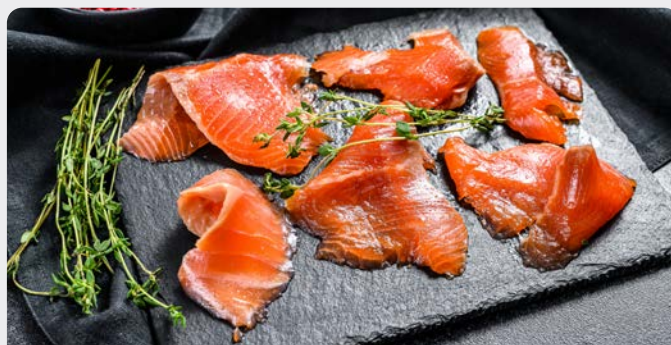
GEROOKTE ZALM VOORGESNEDEN SAUMON FUMÉ PRÉTRANCHÉ