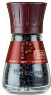
MOLEN PEPER ZWART MOULIN POIVRE NOIR ENTIER