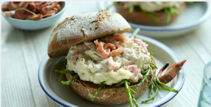
NOORDZEEALADE GRIJZE GARNAAL SALADE DE LA MER DU NORD CREVETTES GRISES

VH VH U: 062.55.086 F: 1503401 U: 062.55.087 F: 1503402 1 kg 5 kg