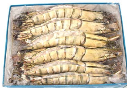
BLACK TIGER BD SPLIT GAMBA RAUW 8-12 BLACK TIGER BD SPLIT GAMBA CRUE 8-12