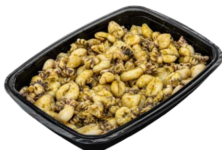
MINI SEPIA PESTOMARINADE MINI SEICHE MARINADE PESTO

Riviera Sopida U: 460.60.003 F: 2004219 1 kg