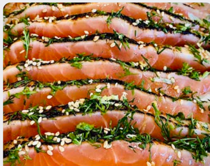
OOSTERS GEKARAMELISEERDE ZALM GEROOKT SAUMON FUMÉ CARAMÉLISÉ À L'ORIENTALE