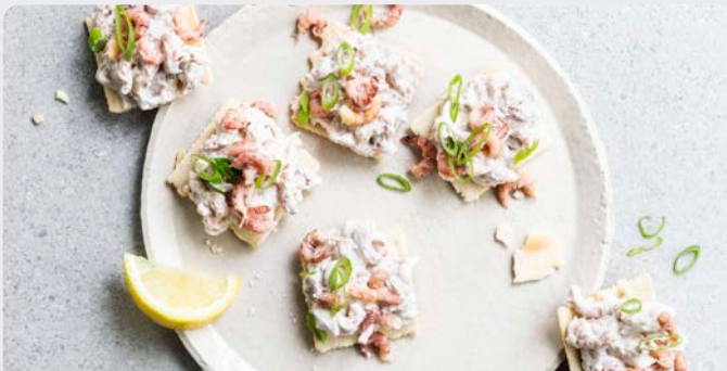
GARNAALSALADE EXTRA MAISON SALADE DE CREVETTES EXTRA MAISON