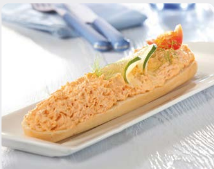
ZALMSALADE SALADE DE SAUMON