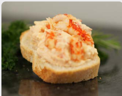
KREEFTCOCKTAIL COCKTAIL DE HOMARD