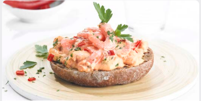
SCAMPI PIKANT SCAMPIS PIQUANTS