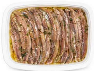
ITALIAANSE ANSJOVIS GEMARINEERD ANCHOIS ITALIENS MARINÉS