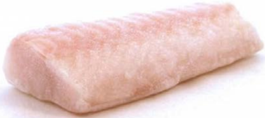
KABELJAUWHAASJES MSC 175G DOS DE CABILLAUD MSC 175G