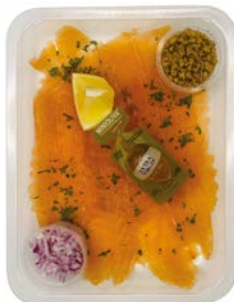
CARPACCIO VAN GEROOKTE ZALM CARPACCIO DE SAUMON FUMÉ

Maison fumée U: 296.60.021 F: 2705058 5x200g