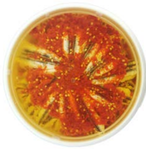
ANSJOVIS ORIENTAL GEMARINEERD ANCHOIS ORIENTAUX MARINÉS