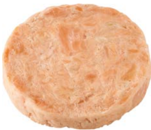
ZALMBURGER BURGER DE SAUMON