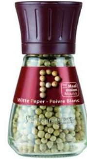
MOLEN PEPER WIT MOULIN POIVRE BLANC ENTIER