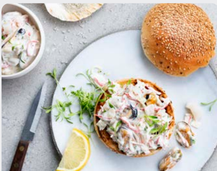
ZEEUWSE MOSSELSALADE SALADE DE MOULES DE ZÉLANDE