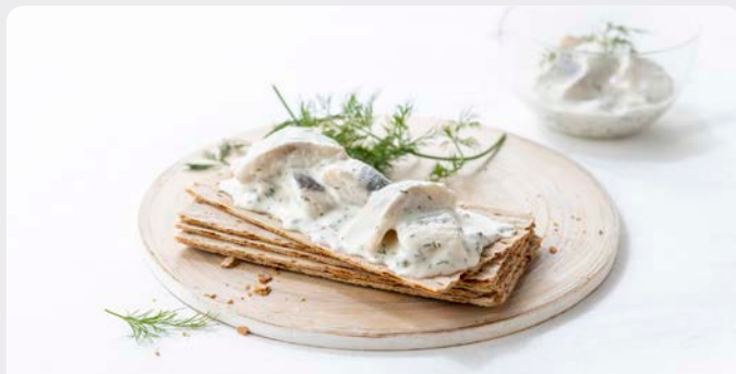
HARINGSALADE TARTAAR SALADE DE HARENG TARTARE