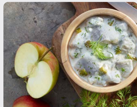
HARINGHAPJES DILLES AUS BOUCHÉES DE HARENG SAUCE À L'ANETH

Deutsche See U: 112.55.003 F: 1503395 1.5 kg