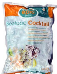
ZEEVRUCHTENCOCKTAIL COCKTAIL DE FRUITS DE MER