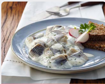
HARINGHAPJES DILLE BOUCHÉES DE HARENG À L'ANETH

Deutsche See U: 112.55.003 F: 1503395 1.5 kg