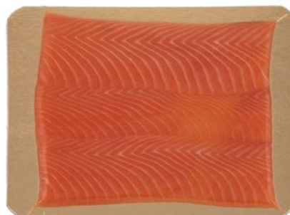
GEROOKTE ZALM TOAST MAP SAUMON FUMÉ TOAST MAP