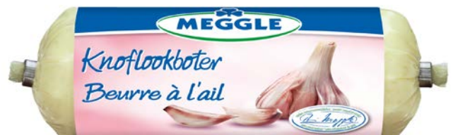
LOOKBOTER BEURRE À L'AIL