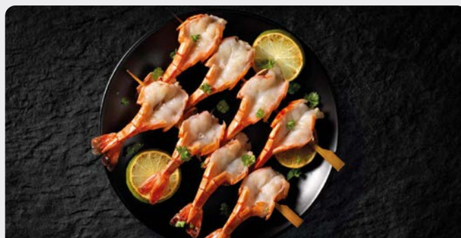
GEMARINEERDE BUTTERFLY GARNALEN CREVETTES BUTTERFLY MARINÉES