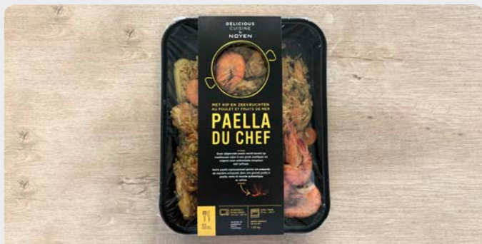
PAELLA VAN DE CHEF PAELLA DU CHEF