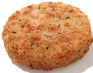
BISTRO ZALMBURGER 90 G ASC GEPANEERD BURGER DE SAUMON BISTRO 90 G PANÉ ASC