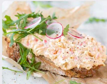
KRABSALADE SALADE DE CRABE

Delitas U: 179.00.350 F: 1503022 1.25 kg