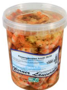
SCAMPI LOOKOLIE SCAMPIS À L'HUILE D'AIL

W. Lauenroth U: 153.60.022 F: 1503301 2 x 1.5 kg