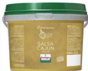
SALSA CAJUN SAUS SAUCE SALSA CAJUN

Verstegen U: 222.97.064 F: 5633001 2.7 l