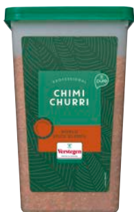
CHIMICHURRI KRUIDEN GROF PURE CHIMICHURRI PURE