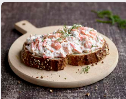
GEROOKTE ATLANTISCHE ZALM SAUMON ATLANTIQUE FUMÉ