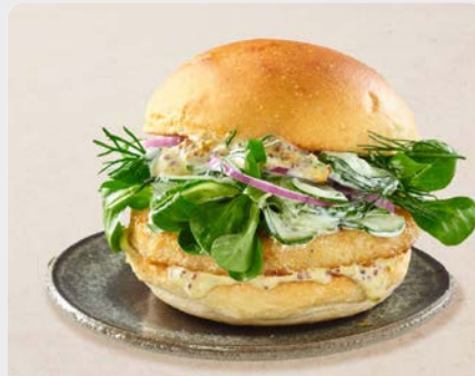
GROTE BURGER VAN KABELJAUW & ALASKA KOOLVIS GRAND BURGER DE CABILLAUD & COLIN D'ALASKA