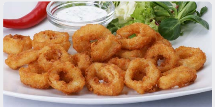
MINI CALAMARESRINGEN GEPANEERD 'BITE SIZE' MINI ANNEAUX DE CALAMARS PANÉS 'BITE SIZE'