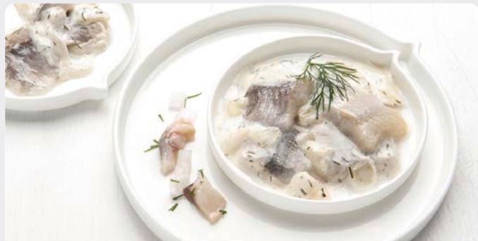
HARINGSALADE IN DILLE SALADE DE HARENG À L'ANETH