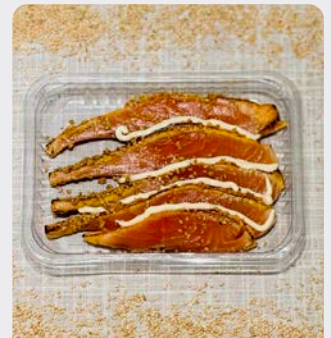
TATAKI VAN ZALM TATAKI DE SAUMON

Maison fumée U: 296.60.011 F: 2705046 5x150g