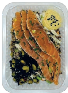
QUINOA SALADE SALADE DE QUINOA

Maison fumée U: 296.86.002 F: 1600006 5x250g