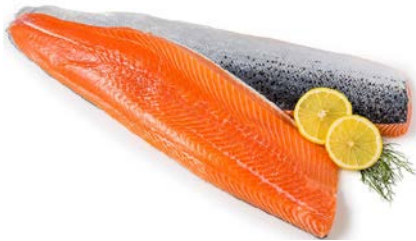
ZALMFILET MET VEL FILET DE SAUMON AVEC PEAU

Deutsche See U: 179.00.231 F: 6202033 4.5 kg ❄️