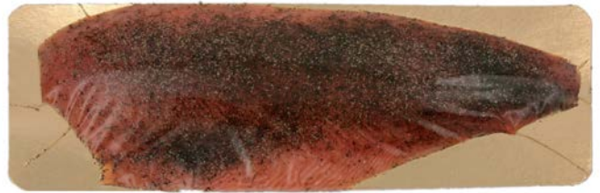
GEMARINEERDE ZALM VOORGESNEDEN SAUMON MARINÉ PRÉTRANCHÉ