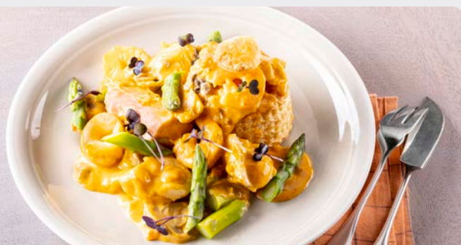
VISPANNETJE DE LUXE CASSOLETTE DE POISSON DE LUXE