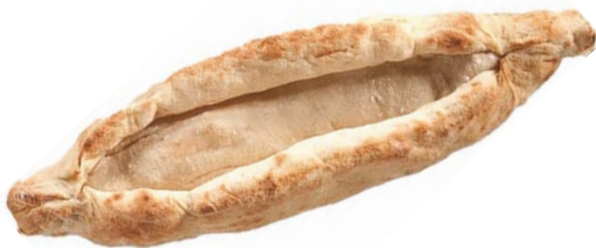
BOOTJES BROOD BARQUETTES EN PAIN