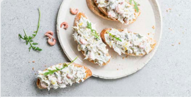
KABELJAUWSALADE SALADE DE CABILLAUD