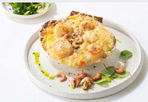
ST.-JACOBSSCHELP PRESTIGE COQUILLE ST.-JACQUES PRESTIGE