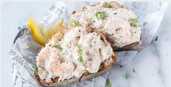
NOORDZEEALADE SALADE MER DU NORD