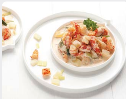
LOUISIANA RIVIERKREEFT COCKTAIL COCKTAIL D'ÉCREVISSES LOUISIANA