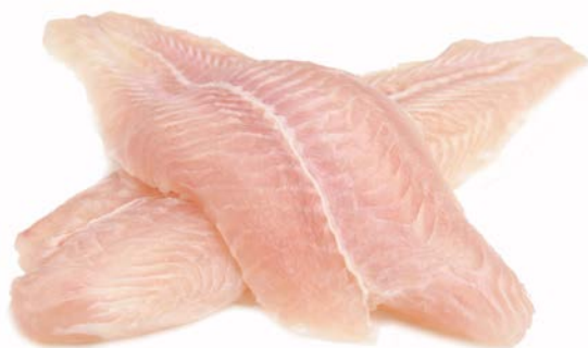
PANGASIUS FILET ZONDER VEL ZONDER GRATEN FILET DE PANGASIUS SANS PEAU SANS ARÊTES