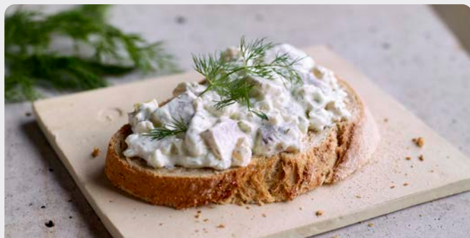
HARINGSALADE DILLE SALADE DE HARENG À L'ANETH