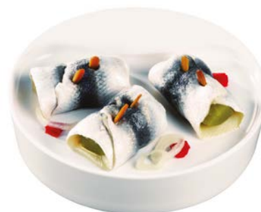
MINI APERO ROLMOPS MINI ROLMOPS APÉRITIF