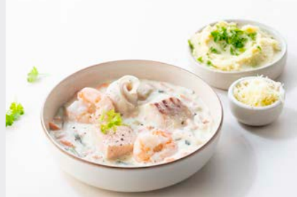
VISSERSPOTJE CASSOLETTE DU PÊCHEUR