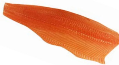
ZALMFILET ZONDER VEL FILET DE SAUMON SANS PEAU

Vanafish U: 179.00.252 F: 3701001 1.2 kg