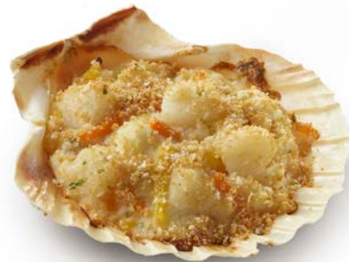
KEIZERLIJKE COQUILLE SCHELP COQUILLE IMPÉRIALE