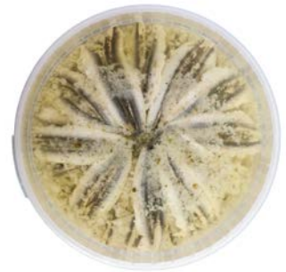
ANSJOVIS LOOK GEMARINEERD ANCHOIS À L'AIL MARINÉS