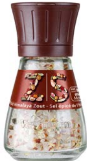
MOLEN GEKRUID HIMALAYAZOUT MOULIN SEL ÉPICÉ DE L'HIMALAYA