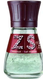
MOLEN ZEEZOUT MOULIN SEL MARIN