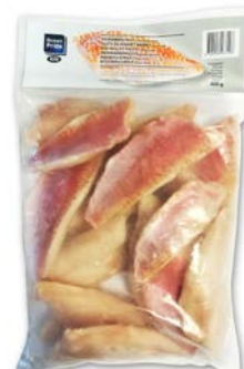
ZEEBARBEEL FILET MET VEL FILET DE ROUGET AVEC PEAU

Ocean pride U: 968.81.016 F: 6202020 800 g 🌸