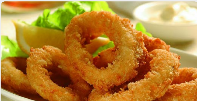
CALAMARESRINGEN PANKO ANNEAUX DE CALAMARS PANKO