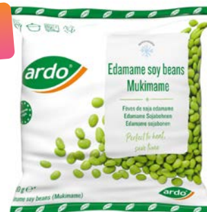
EDAMAME SOJA BONEN FÈVES DE SOJA EDAMAME