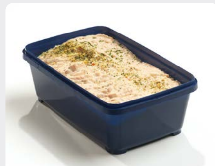
GEROOKTE ZALMSALADE SALADE DE SAUMON FUMÉ

Delitas U: 179.00.344 F: 1503350 1.25 kg