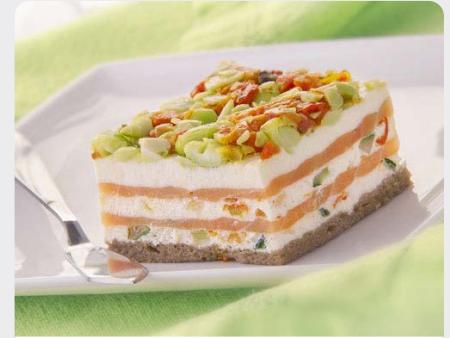
MILLEFEUILLE GEROOKTE ZALM/ GROENTEN MILLEFEUILLE SAUMON FUMÉ/ LÉGUMES