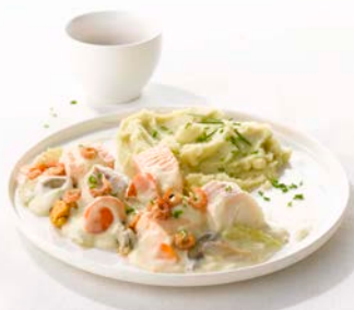
NOORDZEEBLANQUETTE BLANQUETTE DE LA MER DU NORD