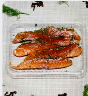
GRAVAD LAX VAN ZALM GRAVAD LAX DE SAUMON

Maison fumée U: 296.60.022 F: 2705059 5x200g