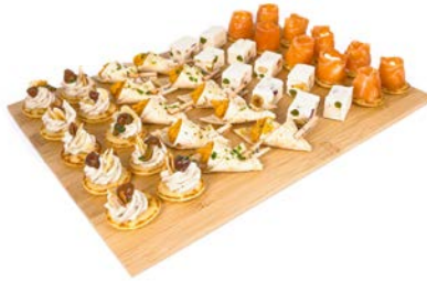
PLATEAU PARADE GOURMANDE 4 SMAKEN PLATEAU PARADE GOURMANDE 4 SAVEURS