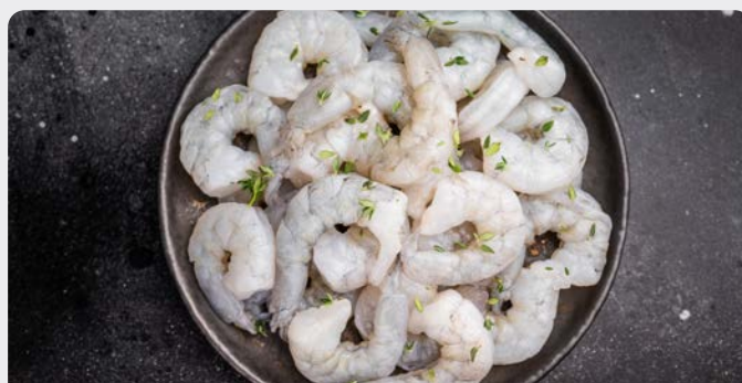
SCAMPI RAUW-GEPELD-ONTDARMD 16/20 SCAMPIS CRUS DÉCORTIQUÉS ET DÉVEINÉS 16/20