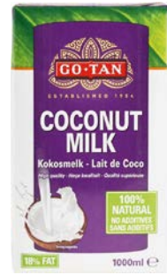
KOKOSMELK LAIT DE COCO