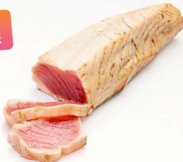
TATAKI TONIJNFILET 250/500 G GEGRILD FILET DE THON TATAKI 250/500 G GRILLÉ