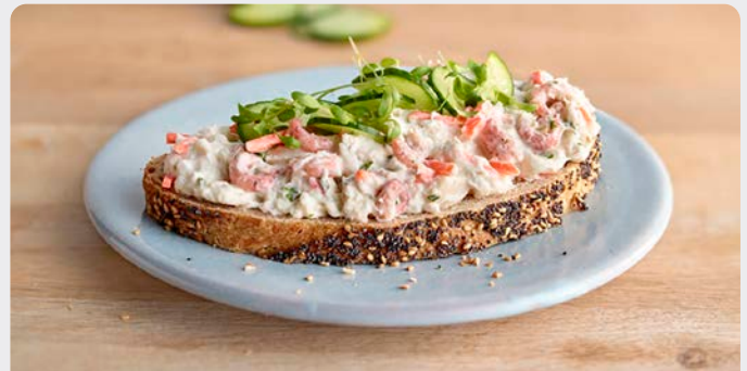
NOORDZEEALADE SALADE DE LA MER DU NORD

VH VH U: 062.55.086 F: 1503401 U: 062.55.087 F: 1503402 1 kg 5 kg