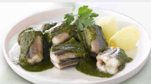
PALING IN HET GROEN ANGUILLE AU VERT