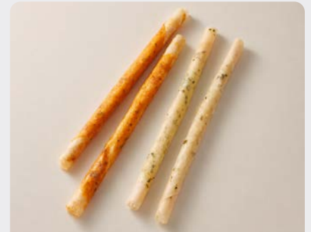
CRISPY STICK ZALM / SAUMON