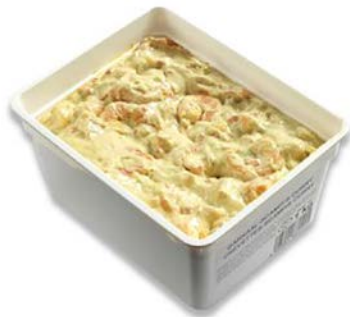
SCAMPI CURRY SCAMPIS AU CURRY