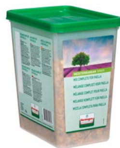
PAELLA MÉLANGE COMPLEET MÉLANGE COMPLET POUR PAËLLA