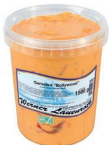
SCAMPI BOLLYWOOD ROOMSAUS SCAMPIS SAUCE CRÈME BOLLYWOOD

W. Lauenroth U: 153.60.022 F: 1503301 2 x 1.5 kg