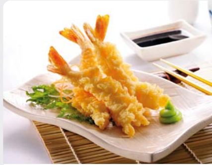
SCAMPI TEMPURA 16/20