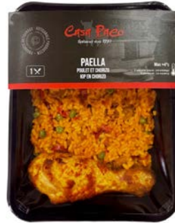
PAËLLA KIP EN CHORIZO PAËLLA POULET CHORIZO

Casa Paco U: 216.86.054 F: 2406018 400 g