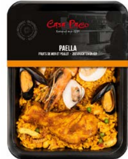
PAËLLA ZEEVRUCHTEN EN KIP PAËLLA POULET FRUITS DE MER

Casa Paco U: 216.86.051 F: 2406022 400 g